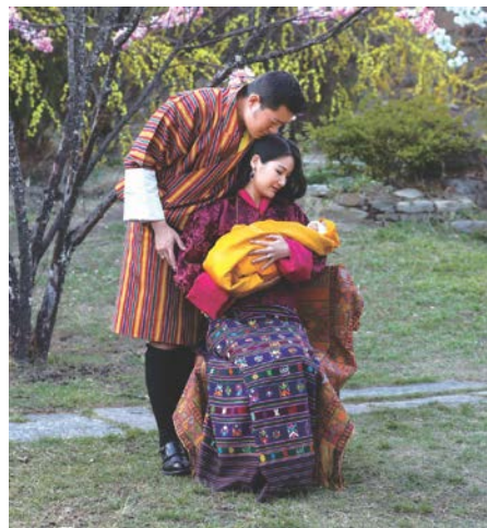
現国王・王妃の衣装

ブータンでは、中世以来、各地の宮殿に織物工房が置かれてきた。初代国王の父の時代から熟練の織り手を抱える王室には、初代国王の儀式用帽子や王座カバー、天蓋をはじめとする優れた衣装や装飾品が伝わっている。また、女性王族たちによって、伝統的な染織産業の保護と発展が進められている。本展では、現国王・王妃が着用された衣装や、2011年に現国王が日本へ寄贈されたブータンシボリアゲハの標本も特別展示する(期間限定11月2日～11月8日)。