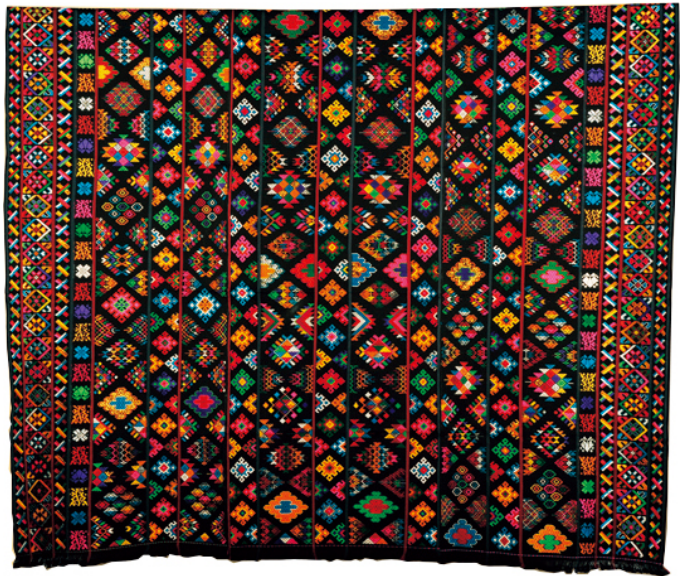
女性用衣装 キラ (20世紀後半/ブータン王立テキスタイルアカデミー)

世界で最も小さな国のひとつであるブータンには、特筆すべき文化的多様性と豊かさがあり、何世紀にもわたって現在まで受け継がれている。とりわけ、17世紀に確立したゾリグ・チュサムという概念は、絵画や塑像、鑄造、刺繍、織物、彫金、鍛金など、13の工芸技術を分類しており、文化遺産の形成に重要な役割を果たしてきた。ここでは、日用品や刀、装身具のほか、特色ある手織物の数々を通じて、ブータン人の生活を多面的に紹介する。