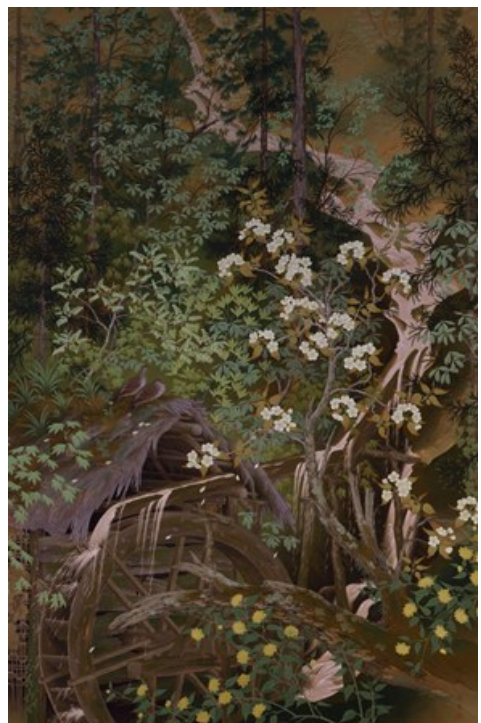
児玉希望 《暮春》 1930(昭和5)年