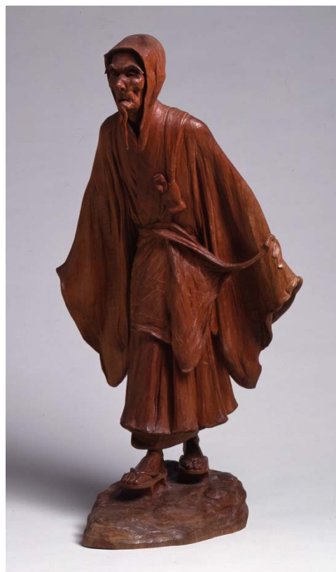
平櫛田中 《落葉》 1913(大正2)年

漆工分野からは、師弟関係にある梶山明細と植松抱民の作品をご紹介します。明細は、13歳の頃から漆技の修業を始め、当初は江戸幕府の元で制作。明治期以降は熟練の技を発揮し、国内外の博覧会への出品を重ねました。抱民は、15歳の時から十年にわたって梶山明細に師事しました。最高水準の技術と、明治期の新しい時代の息吹をこめた意匠を兼ね備え、江戸時代に隆盛した研出蒔絵の最後の名工として知られています。