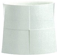
和田 的 白器「ダイ/台」 東京都知事賞