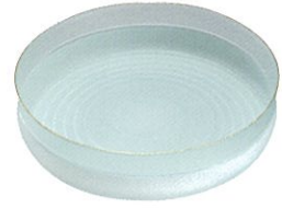
安達征良 硝子胡糸紋平鉢「一零」 文部科学大臣賞