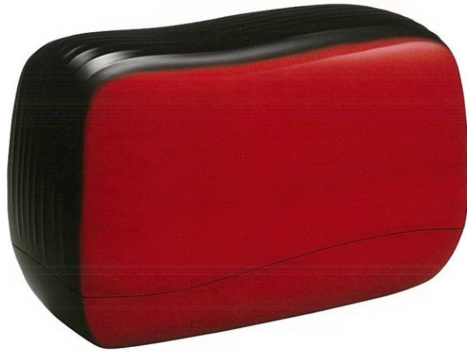
奥井美奈 乾漆「流れる」 日本工芸会総裁賞