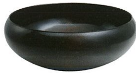
高月國光 柳造鉢 NHK会長賞