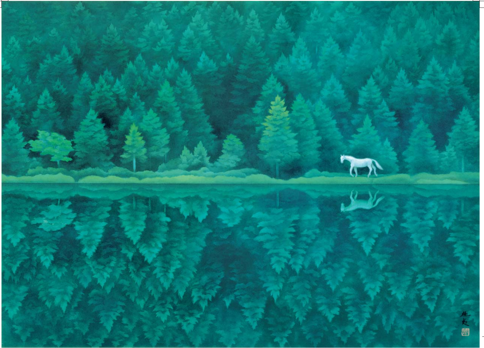
<緑響> 1982年 長野県信濃美術館 東山魁夷館蔵