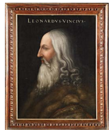
クリストーファノ・デッラルティッシモ [フィレンツェ 1530年頃 - フィレンツェ 1605年] レオナルド・ダ・ヴィンチの肖像 1566-68年 フィレンツェ、ウフィツィ美術館