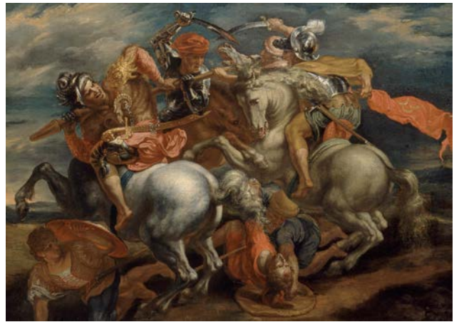
《ピーテル・パウル・ルーベンスに帰属(レオナルド・ダ・ヴィンチに基づく)アンギアーリの戦い》 17世紀初頭 ウィーン美術アカデミー絵画館 Gemäldegalerie der Akademie der bildenden Künste Wien