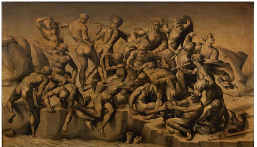
アリストーティレ・ダ・サンガットロ(本名バステアーノ・ダ・サンガットロ)[フィレンツェ 1481年 - フィレンツェ 1551年] カッシナの戦い(ミケランジェロの下絵による模写) 1542年 ホウカム・ホール、レスター伯爵コレクション