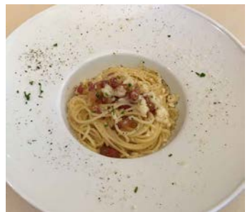
スパゲッティ アツラ グリーチャ