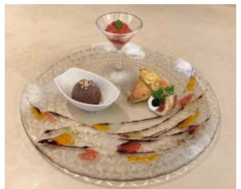
パスティッチョット(ドルチェ)