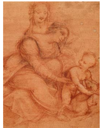
作者不詳(レオナルド・ダ・ヴィンチに基づく) 聖アンナと聖母子 16世紀 ヴェネツィア、アカデミア美術館素描版画室

「アンギアーリの戦い」でレオナルドが追求したのは、人間の凶暴な側面の表現であったといえる。一方、彼の芸術的関心は人間の優美な姿の追求であった。ここでは、レオナルドの精巧な模写作品などにより、彼が追求した優美なる美の世界を紹介する。