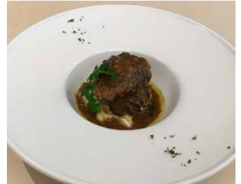
牛テールのオツソ・ブーコ