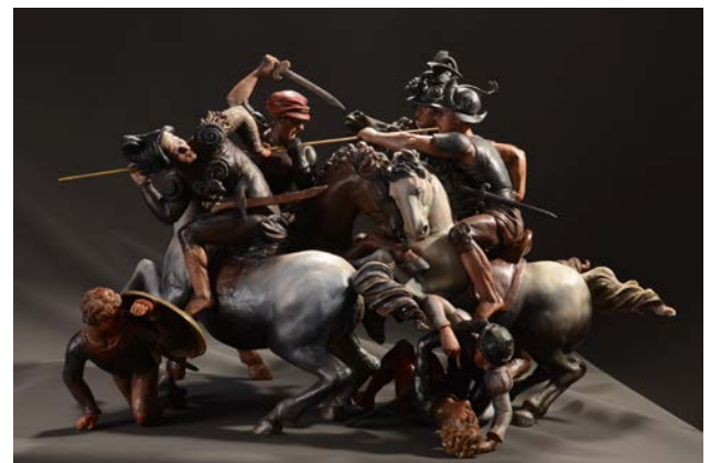
木本諒、井田大介、布山浩司、大石雪野、横川寛人、宮田将寛《タヴォラ・ドーリア》の立体復元彫刻 2015年 東京富士美術館