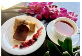
ふわふわメープルシフォンプレート