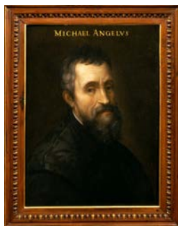
クリストファノ・デッラルティッシモ [フィレンツェ 1530年頃 - フィレンツェ 1605年] ミケランジェロの肖像 1566-68年 フィレンツェ、ウフィツィ美術館 Ex S.S.P.S.A.E e per il Polo Museale della città di Firenze - Gabinetto Fotografico

レオナルドの「アンギアーリの戦い」と同様に、現存しないミケランジェロの「カッシナの戦い」の16世紀の模写を中心に、二大巨匠が成しえなかった幻の競演を再演する。