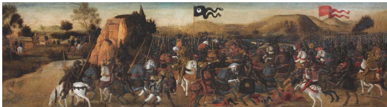
アンドレア・デル・ヴェロッキオ[フィレンツェ 1435年頃—ヴェネツィア 1488年]と工房 ピュドナの戦い 1475年頃 パリ、ジャクマル・アンドレ美術館 Institut de France, Musée Jacquemart André, Paris

壁画のモチーフであるアンギアーリの戦いに関わった人物や、当時の戦闘場面を示す資料を紹介。