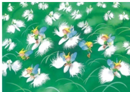
《野原の遊園地》 1994年 カラーインク