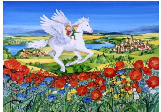
《風の翼》2012年 アクリル、ガッシュ

アクリル絵具は1940年代以降にアメリカで開発が進められた絵具。溶剤にアクリル樹脂を使ったもので、乾燥が他の絵具よりも早く、乾くと耐水性となります。永田が使用する液状のアクリル絵具＝リキテックス・リキッドは、2009年にリキテックス社が販売開始した新しい画材です。カラーインク作品よりも大画面に描かれた力強い色彩の迫力をお楽しみください。