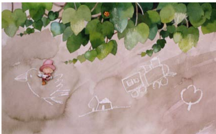
《白いらくがき》1978年 カラーインク

締切を迎えてもアイデアが浮かばなくなってしまった作者が、夢の中で見た絵を描いたというのがこの作品。初期の作品のなかでもユニークなエピソードを持っています。