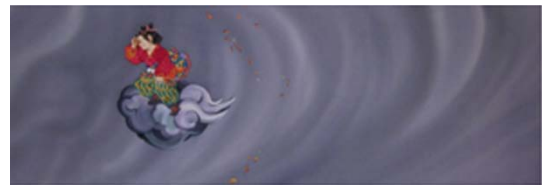
《雷童子》2007年 絹・染料