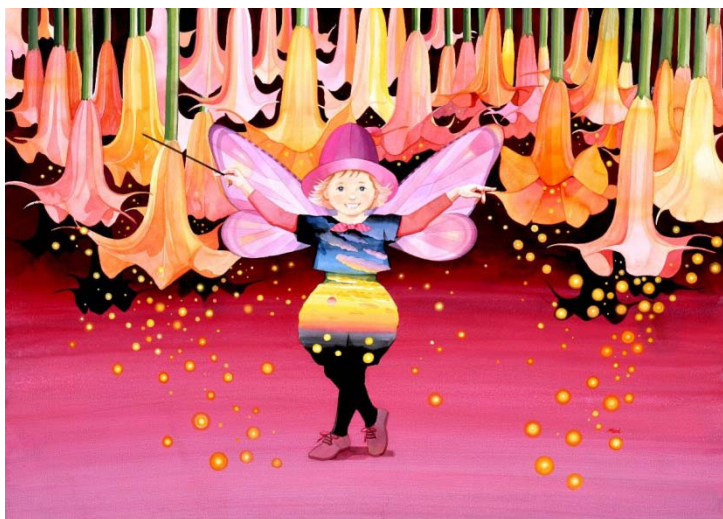
《夕焼け色のコンチェルト》2011年 アクリル、ガッシュ

絹地に友禅技法で描かれた椿。フランスで展示した際に、フランスでは落ちた花は描く対象にならない(のにその落ちた椿を描いている)と話題になったとか。