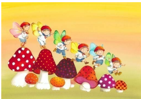
《キュンキュンきのこ組》 2008年 カラーインク

作者はイラストレーターとしてだけでなく、自身が文と絵を制作したオリジナル絵本や絵本の挿絵も描いています。このパートでは、最新のオリジナル・ストーリーである『クリコさんと笑わないクマ』全原画をはじめ、『マッチ売りの少女』や『ふしぎの国のアリス』などさまざまな絵本の仕事も紹介します。