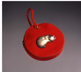
清水南山 《猫金具付 小児用手提》 1939年 銀・彫金・布

工芸作品は人々の生活の身近にある美術作品。工芸作品の中に動物のモチーフを取り入れることで、人々はどんな思いや願いをこめてきたのでしょうか。そして、日本とアジアの工芸作品に見られる、人々と動物とのさまざまな関わりに触れてみましょう。