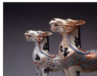
《伊万里柿右衛門様式色絵馬》 17世紀後半 磁器 色絵