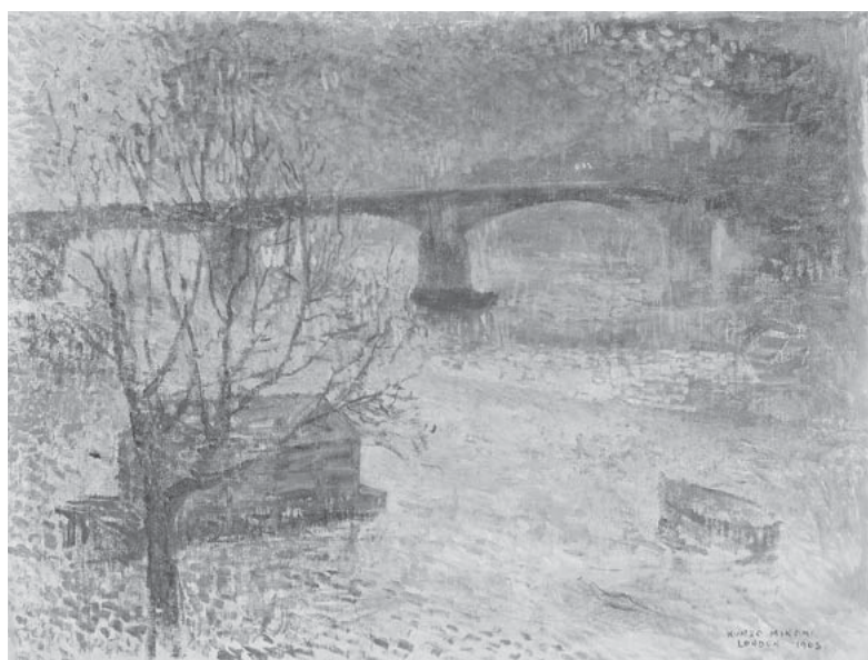
No. 23 南 薫造 《ロンドン河畔》 MINAMI, Kunzo London Riverbank, 1908