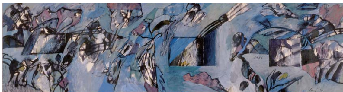
No. 45 野見山 暁治 《渡ってきた神々》 NOMIYAMA, Gyoji Crosed Gods, 1986