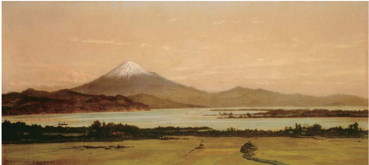
五姓田 義松 《富士》

Second term : 30 October (Tue) — 25 December (Tue)