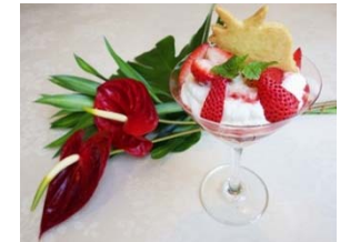
パフェ・ダイナソー