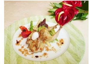
ロースト・ダイナソー