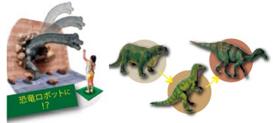
恐竜ロボットによる餌やり体験

恐竜ロボットによる餌やり体験や発掘体験など、楽しく学べるコーナーも！ また、特別展会場内は写真撮影が可能です。