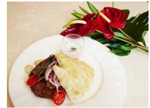
パニーニ・ダイナソー