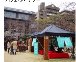
「にわかふえ」の様子