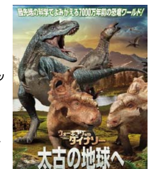
「ウォーキング With ダイナソー ～太古の地球へ～」

当館1階受付でプラネタリウムチケットをご提示いただくと、当日料金から100円引きで本展をお楽しみいただけます。(1枚につき一名様。他割引の併用不可)