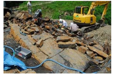
恐竜化石の発掘現場(福井県勝山市)

本展では、この「復元」をテーマに太古の昔、6600万年以上前の地球に実在した恐竜たちの姿に迫ります。