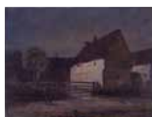
《白壁の農家》1908年 広島県立美術館