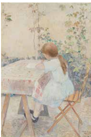
《少女》1909年 東京国立近代美術館