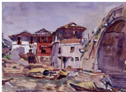
《水辺彩屋》1939年 広島県立美術館【後期展示】

※会期中、一部展示替えがあります(前期4月20日～5月16日、後期5月18日～6月13日)