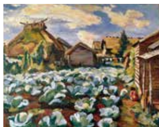
《高原の村の朝》1941年 ひろしま美術館