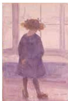
《うしろむき》1909年 広島県立美術館 【前期展示】