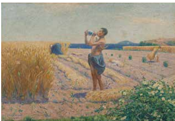
《六月の日》1912年 東京国立近代美術館