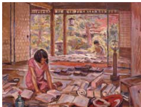
《曝書》1946年 広島県立美術館