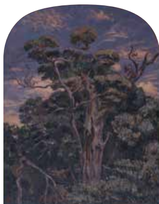
《夏》1919年 ふくやま美術館