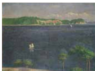
《瀬戸内海》1905年 東京藝術大学

画家の没後70年を記念して開催するこのたびの展覧会は、ヨーロッパ留学時代の作品や、文展や帝展、日展出品作、アジア各地に取材した風景画をはじめとする代表作を網羅し、初期から晩年までの画業の全貌をご紹介します。瀬戸内に取材した伸びやかな油彩画や素朴で愛らしい木版画、季節の変化をみずみずしく捉えた水彩画や日本画、さらには絵日記や絵葉書などの資料も含めたおよそ250点により、豊かで温もりのある色彩に彩られた清新な画業を辿る、決定版の回顧展です。