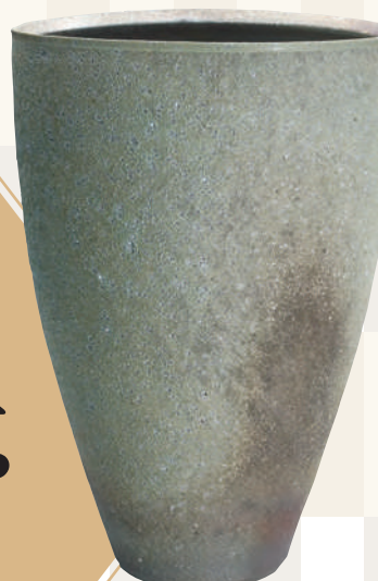
羽石 修二 窯変筒花器 日本工芸会会長賞