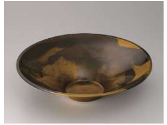
般若泰樹 吹分盤 朝日新聞社賞

金工は文字通り、金属による工芸をいいます。素材は、金、銀、銅、鉄、異なる金属を合わせた合金など。叩いて成形する鍛金、熱く溶かした金属を鑄型に流し込んで成形する鑄金、彫ったり鍍金したりして加飾する彫金など様々な技法による作品を紹介します。