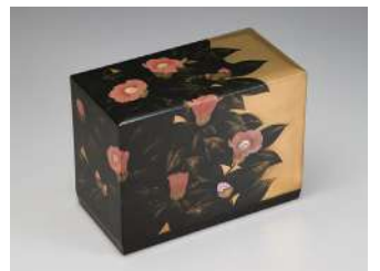
田中義光 蒔絵箱「凜花」 高松宮記念賞