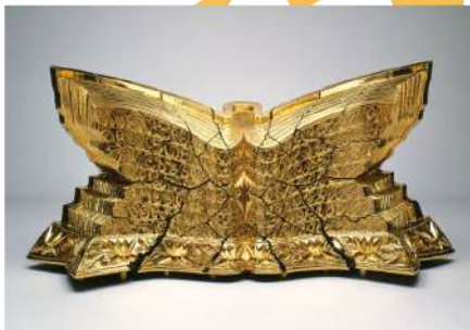
三輪龍氣生 《純・卑弥呼の書No.5》 1992(平成3)年 広島県立美術館蔵