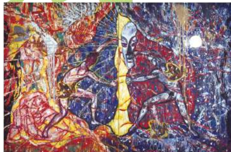
横尾忠則 《天の岩戸》 1985(昭和60)年 広島市現代美術館蔵