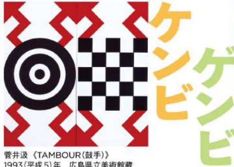
菅井汲 《TAMBOUR(鼓手)》 1993(平成5)年 広島県立美術館蔵