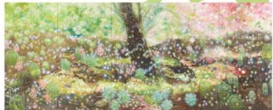
大岩オスカル 《フラワー・ガーデン》2004(平成16)年 左右: 広島市現代美術館蔵、中央: 個人蔵(広島市現代美術館寄託) © Oscar Oiwa