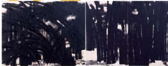
丸木位里 《竹林》1964(昭和39)年 広島県立美術館蔵