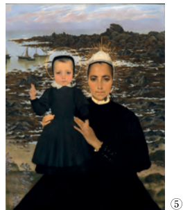
[表面作品] アンリ・モレ《ボン・タヴァンの風景》(部分)1888-89年 油彩・カンヴァス [裏面作品] ① ボール・セリュージェ《さようなら、ゴーギャン》1906年 油彩・カンヴァス ② アルフレッド・ギユ《さらば!》1892年 油彩・カンヴァス ③ モーリス・ドニ《フォルグジュットのバルドン祭》1930年 油彩・カンヴァス ④ フェルディナン・ロワイアン・デュ・ペイユゴド《薬ぶき屋根の家のある風景》1921年 油彩・カンヴァス ⑤ リュシアン・レヴィ＝デュルメール《パンマルの聖母》1896年 油彩・カンヴァス ※全てカンパール美術館蔵 collection du musée des beaux-arts de Quimper