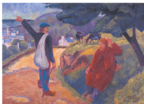
① collection du musée des beaux-arts de Quimper