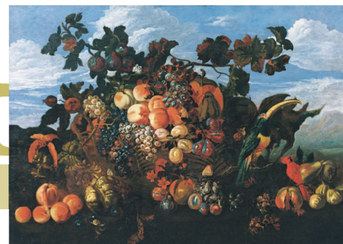
アブラハム・ブリューゲル 《果物の静物がある風景》 1670年 Private Collection