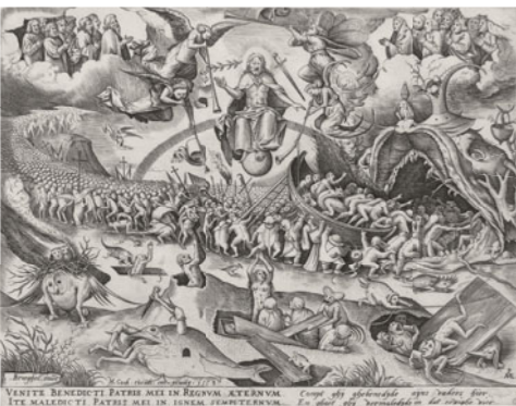
ピーテル・ブリューゲル1世(下絵)、ピーテル・ファン・デル・ヘイデン(彫版) 《最後の審判》 1558年 Private Collection