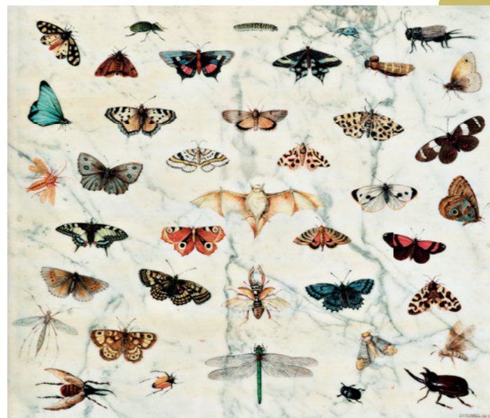
《蝶カットモンシロキの習作》 1679年 Private Collection, USA ヤン・ファン・ケッセル1世