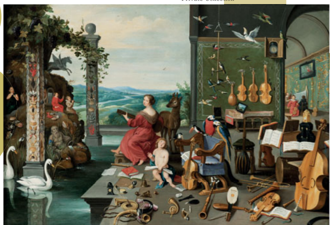
ヤン・ブリューゲル2世 《聴覚の寓意》 1643-1650年頃 Private Collection