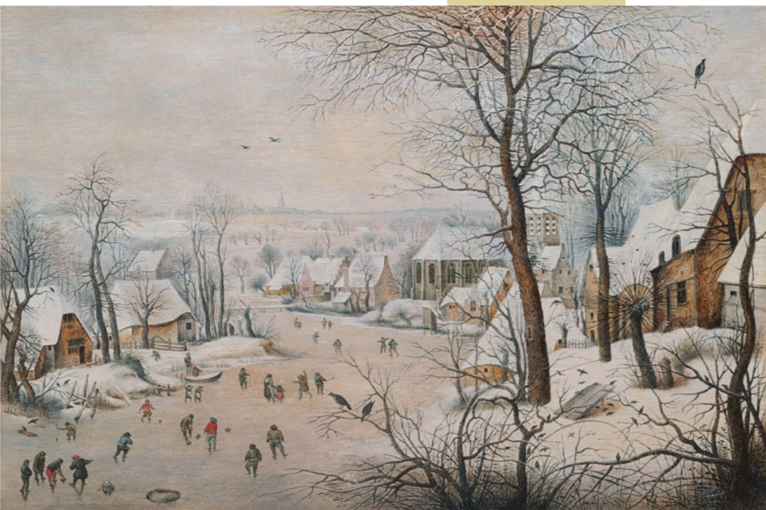
ピーテル・ブリューゲル2世(冬景) Private Collection, Luxembourg 1601年