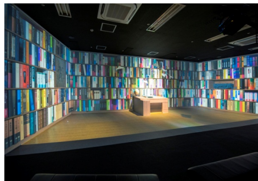
SF(すこしふしぎ)シアター

ドラえもん、のび太といっしょに、タイムマシンによって、すこしふしぎな冒険の旅に出発！